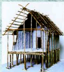
Rekonstruktion eines jungsteinzeitlichen Hauses aus der Ufersiedlung von Hornstaad am Bodensee (3900 v. Chr.).

Im Labor werden die Pflanzenreste aus den Seeablagerungen geschlämmt und anschließend botanisch bestimmt – hier eine fast vollständige Weizenähre.