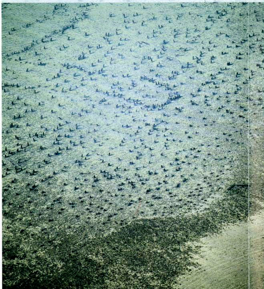
Vorgeschichtliches Pfahlfeld im Uferbereich des Bodensees.